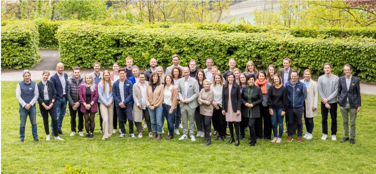
Abschluss des Ausbildungsprogramms für Nachhaltigkeitskoordinator:innen im April 2024

Die enge Zusammenarbeit zwischen den Tourismusverbänden wird durch regelmäßige Netzwerktreffen der Nachhaltigkeitskoordinator:innen und digitale Plattformen – organisiert und begleitet von der Tirol Werbung - weiter gestärkt. Dies schafft nicht nur Grundlagen für kontinuierliche gemeinsame Weiterentwicklungen von Projekten sondern trägt darüber hinaus zur Vertiefung eines gemeinsamen Wissenspools bei und fördert innovative Lösungsansätze.